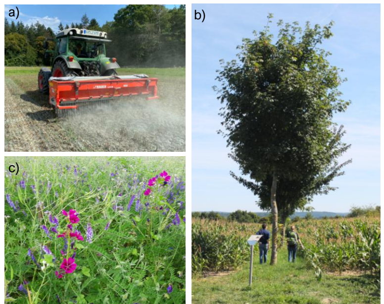
Fig. 2 : Mesures possibles pour la séquestration du carbone : a) Altération forcée des roches, b) Agroforesterie, c) Cultures dérobées.