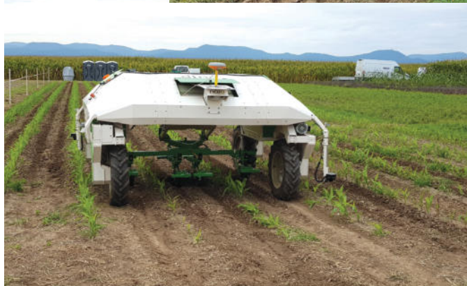
Robot désherbeur Dino de chez Naïo